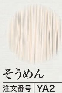
そうめん 注文番号 YA2