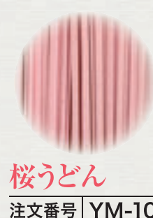
桜うどん 注文番号 YM-10