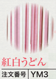
紅白うどん 注文番号 YM3