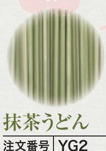
抹茶うどん 注文番号 YG2