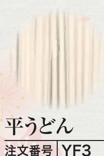
平うどん 注文番号 YF3