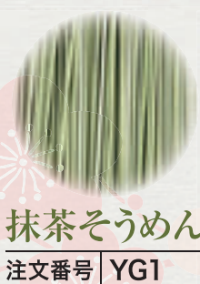
抹茶そうめん 注文番号 YG1