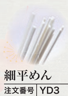
細平めん 注文番号 YD3