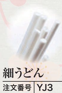
細うどん 注文番号 YJ3