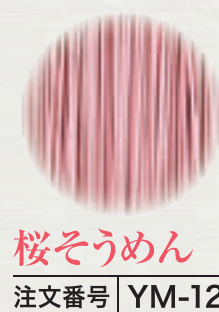
桜そうめん 注文番号 YM-12